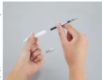
【1人1人の嗜好に合わせてパーツの組み合わせを変えることが可能】

個人の嗜好が多様化しているこの時代に、文房具は事務用途を満たすだけの道具から、自分らしさを表現する道具にかわりつつあるのかもしれませんが。1人1人のワガママを満たす商品発想が新たなビジネスチャンスを生み出す可能性を示唆しています。文房具に限らず既存概念に捉われない新たな発想、ちょっとした工夫で生まれる商品アイデアが消費者の新たなニーズを創出するかもしれません。皆様がお持ちのアイデアを商工会と一緒に形にしてみませんか？